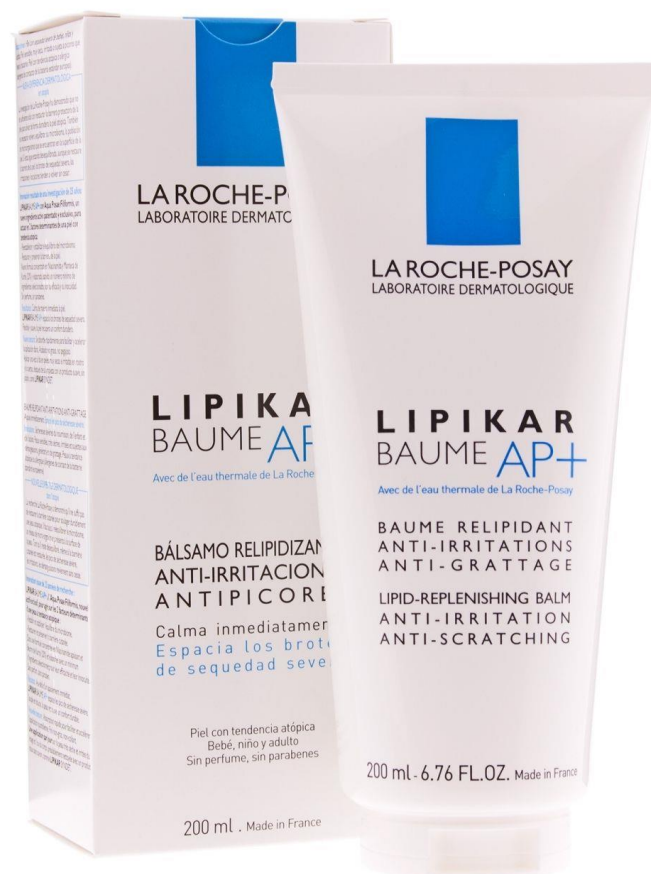
Схема получения скидки 38% на средства для борьбы с атопическим дерматитом в интернет магазине La Roche Posay ( www.laroche-posay.ru )